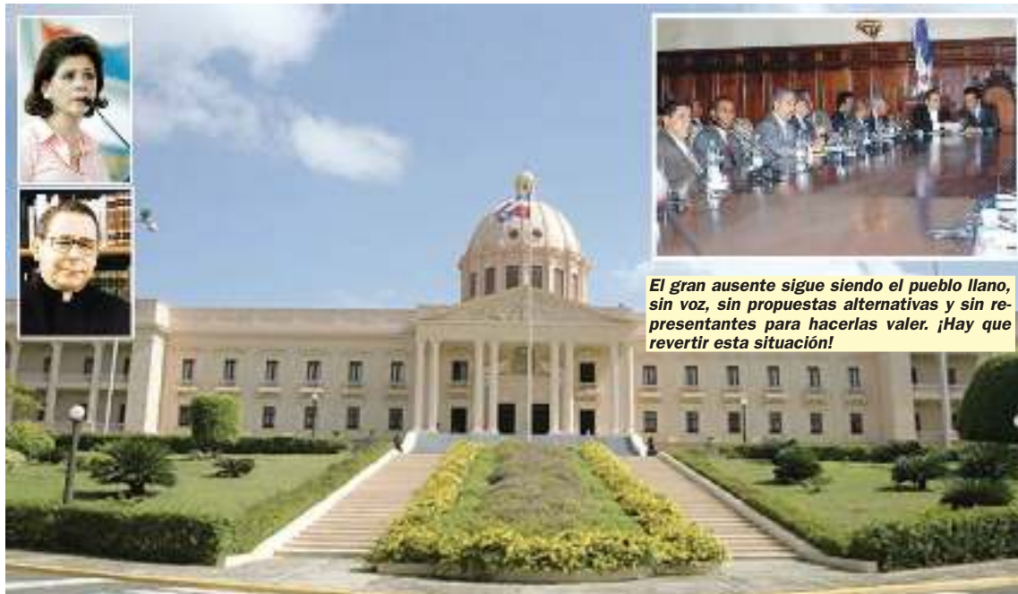
El gran ausente sigue siendo el pueblo llano, sin voz, sin propuestas alternativas y sin representantes para hacerlas valer. ¡Hay que revertir esta situación!

La inminente entrada en vigencia del DR-CAFTA, el funesto acuerdo comercial impuesto al país, activó la búsqueda de consenso para la reforma fiscal.