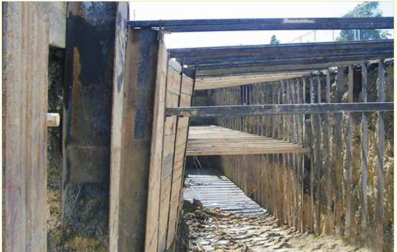
La falta de estudios previos ha obligado a soluciones improvisadas.

Tampoco se ha hecho un estudio de refracción sísmica para determinar as