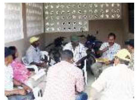
EL TALLER. Uno de los grupos en plena discusión.

En ambos casos, en su lucha contra los enemigos de fuera y por sus reivindicaciones, estas organizaciones han recibido apoyo de activistas sociales, intelectuales, técnicos, y de instituciones como la Academia de Ciencias y el INFOTEP, el PNUD, Fundaciones ambientalistas, la UASD. Hoy procuran el apoyo de la FAO, Misión Japonesa y otras instituciones. En proyectos de ecoturismo, formación artesanal, piscicultura y la creación de la Ruta de la Yautía, en el