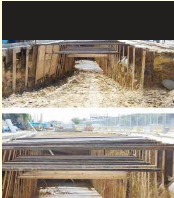
Traviesas, que apenas permiten el trabajo, colocadas para enfrentar lo arcilloso del terreno. Otro resultado de la falta de estudio previo.

5.- El cambio de las correas de transmisión de las hegemonías económicas y