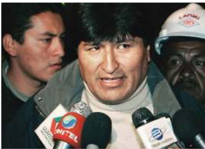
ALERTA NACIONAL se realiza en condiciones precarias debido a la negligencia de las autoridades educativas. Siempre ha habido

Lo fundamental en las nuevas situaciones que se vienen presentando en el continente, principalmente en los países del sur, es preservar la unidad y la independencia del movimiento popular con sus distintos y diversos sectores, definir cada vez mejor sus objetivos concretos y su programa político, y esforzarse por fortalecer esta unidad y al movimiento mismo, apoyar todo lo promisorio que emane de la acción de estos gobier-