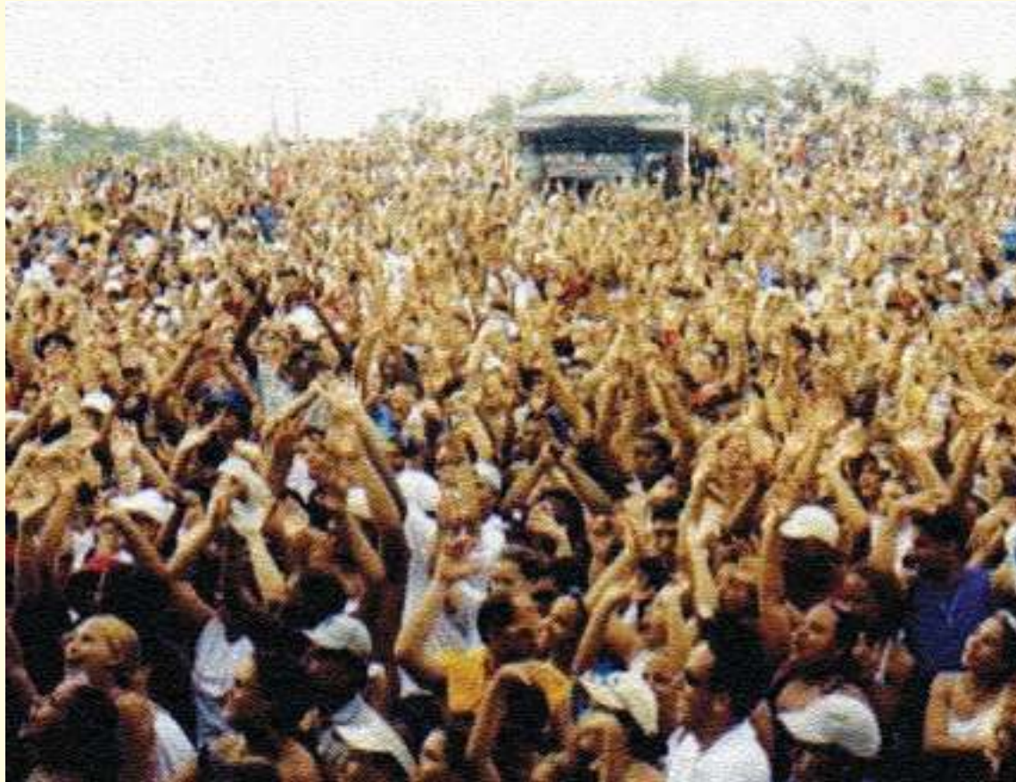
Hay que avanzar hacia una plataforma programática del movimiento social, concreta y clara, para iluminar y conducir las luchas que están por llegar.

Los órganos tripartitos del Estado y de organismos internacionales, de conquista de los trabajadores, han devenido en frustración. Los trabajadores no tienen ningún control sobre sus representantes. Estos se representan a sí mismos. La representación sindical en los órganos tripartitos ha venido a ser oportunidad para la cor-