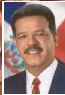
Leonel Fernández Reyna, Presidente de la República.

Más allá de violaciones e inconsistencias